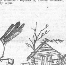
Препариат в воробья Сольвар-разбойника