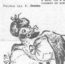
Рисунг гда Г. Левина

В феврале и не выполнял норму. Это случилось со мной в первый раз. В чем дело? — спрашивал и себя. И нашел причину. Меня перепалили из-за отсутствия деталей, которые сразу не удалось освоить. Я недолгому трудились, не понадеялся, что требовалось больше напряжения, выносливости и работы так же, как раньше.